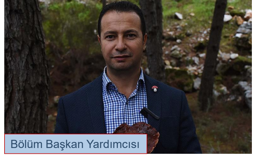
Bölüm Başkan Yardımcısı